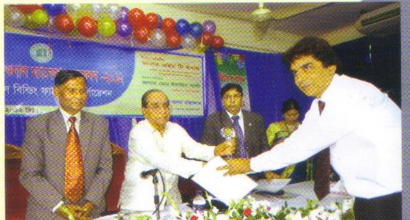
২৪ সেপ্টেম্বর ২০১২: ঋণ আদায়ে কৃতিত্বের সম্মাননা সনদ নিচ্ছেন একজন আঞ্চলিক ব্যবস্থাপক