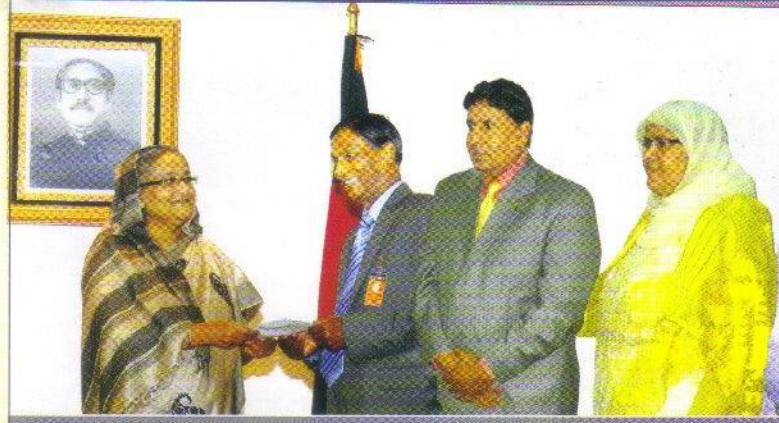
৫ মে ২০১৩ : মাননীয় প্রধানমন্ত্রীর কল্যাণ তহবিলে চেয়ারম্যান কর্তৃক অনুদানের চেক প্রদান