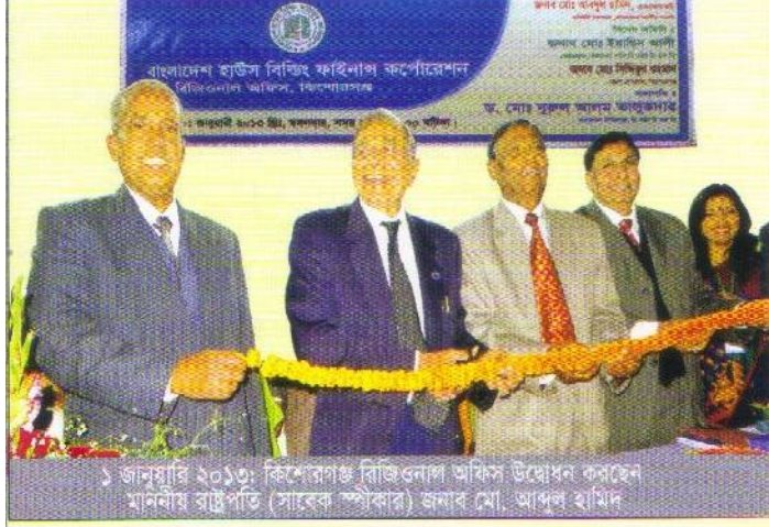
১ জানুয়ারি ২০১৩: কিশোরগঞ্জ রিজিওনাল অফিস উদ্বোধন করছেন মাননীয় রাষ্ট্রপতি (সাবেক স্পীকার) জম্মা মো. আব্দুল হামিদ