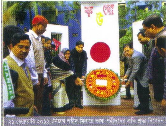
২১ ফেব্রুয়ারি ২০১২: নিজস্ব শহীদ মিনারে ভাষা শহীদদের প্রতি শ্রদ্ধা নিবেদন

গৃহায়ণে ঋণ সহায়তা ও সেবা সৃষ্টির পাশাপাশি ব্যবসায়িক লক্ষ্য অর্জনের নীতির প্রতি অবিচল অবস্থানে থাকতে হয় বিএইচবিএফসি-কে। এ লক্ষ্যে তিন বছরে ব্যবসায়িক কার্যক্রম সম্প্রসারণে ক্যাম্প ও রিজিওনাল অফিস প্রতিষ্ঠা, ঋণের সিলিং বৃদ্ধি, ঋণ সম্প্রসারণ প্রচারণা, দীর্ঘসূত্রিতা ও হয়রানি বন্ধকরণ, স্বচ্ছতা ও জবাবদিহিতা বৃদ্ধি, One Stop Service Center প্রতিষ্ঠা, Help Desk স্থাপন, তহবিল বৃদ্ধির লক্ষ্যে PO-7 সংশোধনের উদ্যোগ, সরকার ও বাংলাদেশ ব্যাংক থেকে অর্থপ্রাপ্তির প্রচেষ্টা, বার্ষিক উন্নয়ন প্রকল্পে বিশেষ কর্মসূচি অন্তর্ভুক্তকরণ এমনকি বিশ্বব্যাংক থেকে ঋণ সংগ্রহের চেষ্টা অব্যাহত আছে।