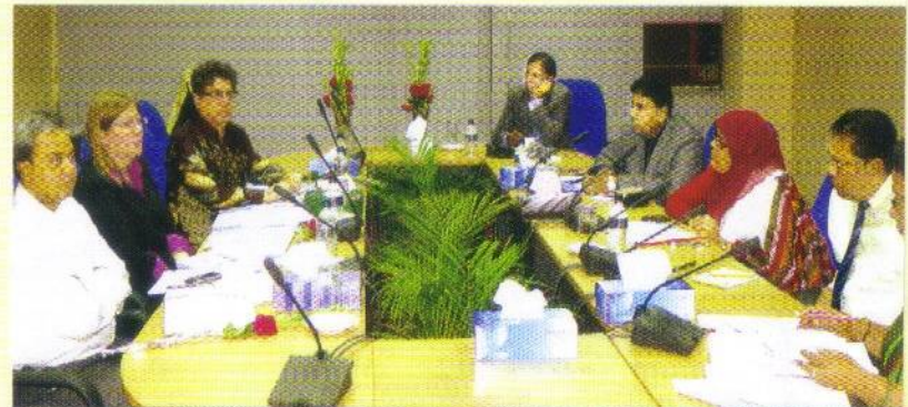
২ এপ্রিল ২০১৩ : বিশ্বব্যাংক প্রতিনিধি দলের সাথে বৈঠকের একটি মুহূর্ত

এসময় সামাজিক ও মানবিক কর্মকাণ্ড পরিচালনার্থে সিএসআর খাত চালু করা হয়। প্রধানমন্ত্রীর কল্যাণ তহবিলে অনুদান প্রদান, মেধাবৃত্তি প্রবর্তন, বিএইচবিএফসি স্টাফ কোয়ার্টার উচ্চ বিদ্যালয়ের উন্নয়ন, শীতর্তদের মাঝে শীত বস্ত্র বিতরণ ও বৃক্ষ রোপন কর্মসূচির মতো জনতিহকর কার্যক্রমে অবদান রাখা হয়। চিত্তবিনোদন ও সাংস্কৃতিক অনুষ্ঠান হিসেবে ক্রীড়াপ্রতিযোগিতা ও চিত্তবিনোদন অনুষ্ঠান, বাংলা বর্ষবরণ, বনভোজন ও রিক্রিয়েশনের জন্য পর্যাপ্ত অনুষ্ঠানের আয়োজন করা হয়।