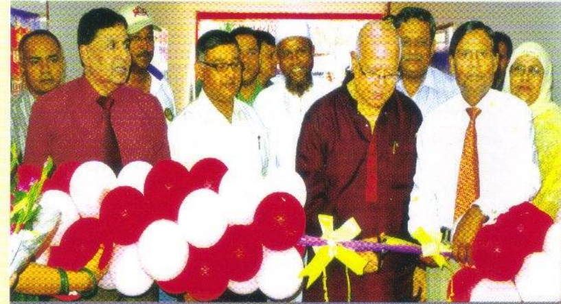
২৩ জুন ২০১২ : সদর দপ্তর ভবনের প্রধান ফটক উদ্বোধন করছেন মাননীয় অর্থমন্ত্রী

বিগত তিন বছরে কর্তৃপক্ষ আন্তর্জাতিক মাতৃভাষা ও শহীদ দিবস, মহান স্বাধীনতা দিবস, জাতীয় শোক দিবস এবং মহান বিজয় দিবসের মতো জাতীয়