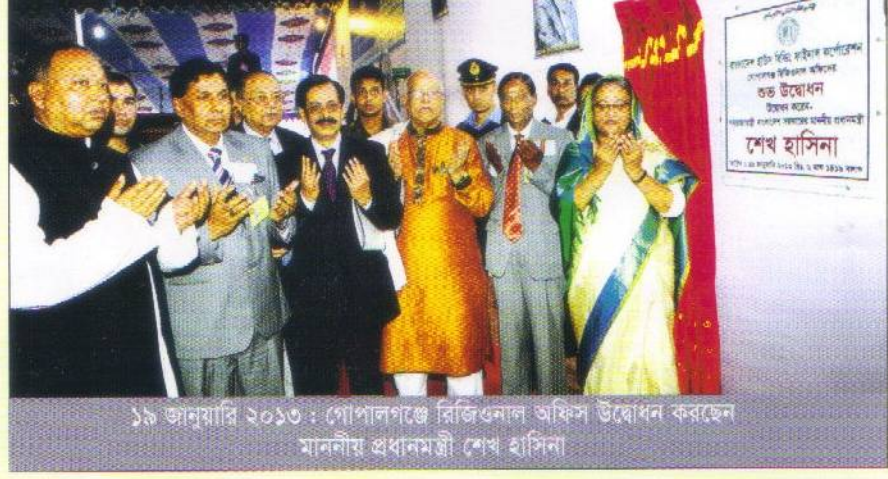
১৯ জানুয়ারি ২০১৩: গোপালগঞ্জ রিজিওনাল অফিস উদ্বোধন করছেন মাননীয় প্রধানমন্ত্রী শেখ হাসিনা