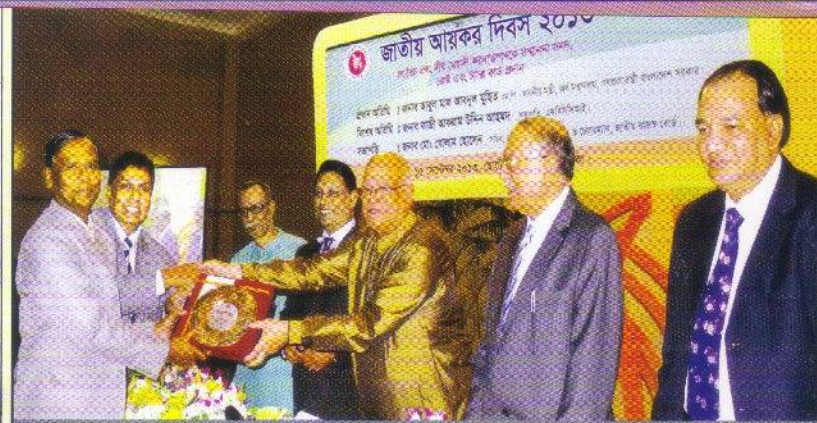
১৫ সেপ্টেম্বর ২০১৩ : ট্যাক্স-কার্ড সম্মাননা গ্রহণ করছেন চেয়ারম্যান ও ব্যবস্থাপনা পরিচালক

ঋণ প্রক্রিয়া সহজ করার লক্ষ্যে রিজিওনাল অফিসের সুপারিশে ঋণ মঞ্জুর এবং ঋণ বিতরণে শহর ও মফস্বলের ব্যবধান হ্রাসের পদক্ষেপ নেয়া হয়েছে। বিগত তিন বছরে খেলাপী ঋণ, বিশেষত শ্রেণীকৃত খেলাপী ঋণ আদায়কে সর্বাধিক গুরুত্ব দিয়ে সর্বাঙ্গিক আদায় তৎপরতা পরিচালনা করা হয়।